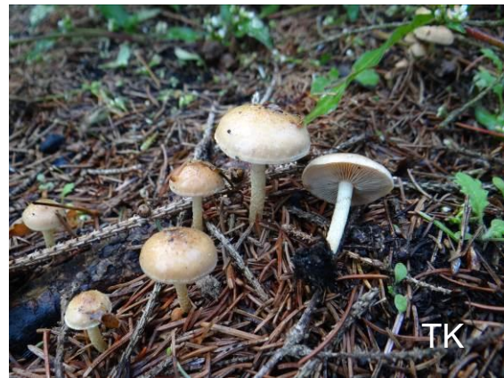
Abb. 14: Kohlenschüppling

als obligater Brandstellenbesiedler. Als weiterer Brandstellenpilz gesellte sich das Höckersporige Graublatt ( Lyophyllum ambustum ) hinzu. Später wurde der Kohlenschüppling auch in Duisburg auf einer Brandstelle im Wald gefunden. Die Art ist auf Brandstellen relativ häufig.