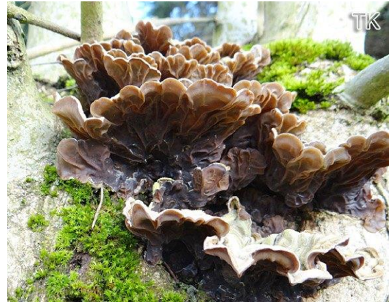
Abb. 2: Gezonter Ohrlappenpilz auf Esche

Bei Trockenheit können die Fruchtkörper sehr stark einschrumpfen. Hauptsubstrat sind Pappel und Esche, in höheren Lagen auch Buche. Hauptlebensraum des Gezonten Ohrlappenpilzes sind Auwälder, Flussniederungen und Schluchtwälder.