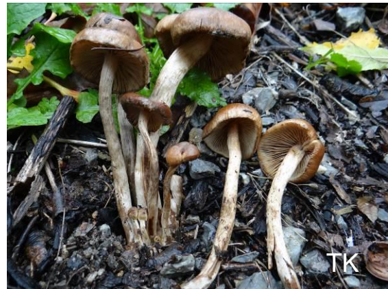
Abb. 17: Tränender Saumpilz

Fransen. Die Lamellen sind dunkelbraun, mit hellen Schneiden und mit kleinen Tröpfchen besetzt, welche dunkle Flecken hinterlassen, wenn sie eintrocknen. Dies alles passte nur sehr bedingt. Es handelte sich um eine sterile Form des Tränenden Saumpilzes. Steril heißt dabei, dass nur wenige Sporen gebildet werden. Dieses Phänomen ist vor allen vom Rauchblättrigen und Grünblättrigen Schwefelkopf bekannt und fällt generell bei Dunkelsporen auf, da dann die Farbe der Lamelle sichtbar wird, die sonst von den Sporen überdeckt wird. Der Tränende Saumpilz in der normalen Form war 2019 sehr häufig, z.B. in Parkanlagen und auf Friedhöfen.