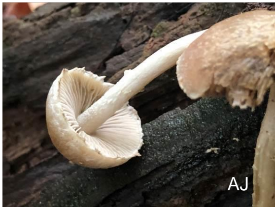
Abb. 16: Reichbeschleierter Mürbling

Ebenfalls in Hilchenbach wuchs auf einem morschem Buchenstamm der Reichbeschleierte Mürbling ( Psathyrella spintrigeroides ). Dieser Mürbling kann leicht mit ähnlichen aussehenden Arten wie z. B. P. olympiana , P. artemisiae und P. rostellata verwechselt werden. Mikroskopisch sind jedoch die zahlreichen spitzen und im oberen Teil dickwandigen Pleurocystiden markant. Der Hut wird ca. 4 cm breit. Die Seite www.pilze-deutschland.de listet für NRW 60 Arten der Gattung Psathyrella auf. Nah verwandt sind noch die Gattungen Lacrymaria (2 Arten), Homophron (2 Arten), Parasola (9 Arten) und Coprinopsis (59 Arten). Die Art wird meist auf Buche gefunden, ENDERLE (1989) fand sie auch auf Fichte. Für NRW ist lediglich ein Fundpunkt angegeben.