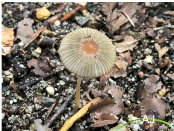
Abb. 7: Kleinsporiger Scheibchentintling

Im Juni wurde der Kleinsporige Scheibchentintling ( Parasola kuehneri ) in Castrop-Rauxel und im Juli in Essen gefunden. Die Art gehört zu dem Scheibchen-Tintling-Komplex ( Parasola plicatilis -Komplex). Sie ist anhand der rotbräunlichen Hutfärbung und der kleinen Sporen erkennbar. Sie ist viel häufiger als P. plicatilis . Da sie erst 1988 beschrieben wurde (ULJE & BAS 1988), wurde sie lange nicht von P. plicatilis unterschieden. Ähnliche Arten sind P. leiocephala und P. hemerobia . Die Gattung Parasola wurde erst vor einigen Jahren von der Gattung Coprinus abgespalten und zusammen mit Coprinellus und Coprinopsis zur Familie Psathyrellaceae gestellt (REDHEAD 2001).