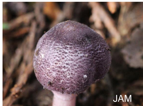
Abb. 20: Veilchenfarbener Egerlingsschirmling

Ebenfalls im November gelang im Essener Grugapark ein weiterer Neufund für NRW. Unter Nadelbäumen wuchs der Veilchenfarbene Egerlingsschirmling ( Leucoagaricus ionidicolor ). Diese Art ist in ganz Europa selten. Im Bulletin der AMFB 2015/08 (CLESSE 2015) werden die ökologischen Präferenzen der Art so beschrieben: terrestrischer Saprophyt, oft unter Nadelbäumen und in einer mehr oder weniger ruderalisierten Station (Park, Arboretum). Dies beschreibt treffend den Fundort in der Essener Gruga. Für die Art sind in Deutschland nur drei Fundpunkte angegeben. In Wetzlar wuchs die Art zusammen mit Leucoagaricus badhamii (ZÜHLSDORF 2016), was auch auf den Essener Fund zutrifft.