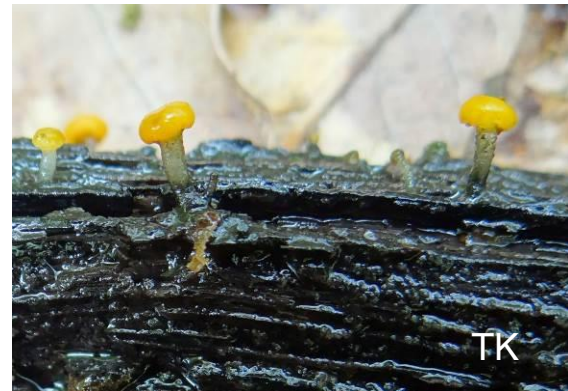
Abb. 5: Abgestutztes Fadenscheibchen

Ende Mai wuchs in Wermelskirchen (an der Stadtgrenze zu Remscheid) in einem Quellbach an im Wasser liegenden Holz das Abgestutzte Fadenscheibchen ( Vibrissea truncorum ). Ein anderer deutscher Name für Vibrissea ist "Tentakelkeulchen". Der Name beruht auf der Eigenschaft beim Eintrocknen Sporen aus dem Hut aktiv auszustößen, die teilweise am Hut kleben bleiben und sich im Luftzug wie Tentakel bewegen. Da die Fruchtkörper knapp oberhalb der Wasseroberfläche wachsen, bedeutet diese Form des Aussporens eine hydrochore Sporenverbreitung (=auf dem Wasserweg).