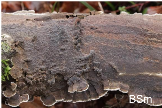
Abb. 3: Rußbrauner Schichtpilz

wurde der Gattungsname in Mytilidion geändert, der ältere Name besitzt jedoch Priorität. Dieses winzige Pilzchen wächst auf Ästen von Fichte, Lärche und Kiefer. Ähnlich ist die Große Kiefernmuschel ( Lophium mytilinum ), die ebenfalls auf Ästen verschiedener Nadelhölzer wächst. L. mytilinum besitzt fadenförmige Sporen von 120–175 x 1,5–2 µm, während die Sporen von M. mytilinellum 16-22 x 3-4 µm groß sind (BOEHM 2019).