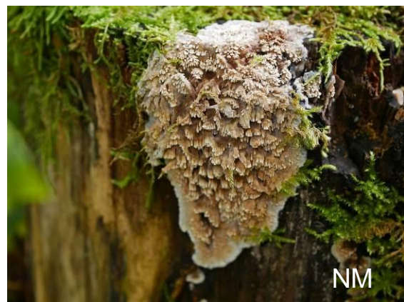
Abb. 15: Scheinbuchen-Fadenstachelpilz

Im Oktober fand die mehrtägige Herbstexkursion in Hilchenbach statt. Dort wuchs an einem Buchenstumpf der Scheinbuchen-Fadenstachelpilz ( Mycoacia nothofagi ). Dieser stachelige Holzbewohner wurde zuerst in Neuseeland von Cunningham 1959 als Odontia nothofagi von Nothofagus (=Scheinbuche) beschrieben. Etwas später wurde die Art mehrfach in Europa gefunden, sie ist aber kein Neomyzet. SCHMID ET AL. 2012 stufen ihn als Naturnähezeiger ein. Unser Fund im Siegerland war der Zweitfund für NRW. Mikroskopisch ist die Art durch Lamprocystiden (= dickwandige, inkrustierte Cystiden) gekennzeichnet. Makroskopisch ist ein süß-säuerlicher Geruch (Obstbrand Williams-Christ-Birne) typisch.