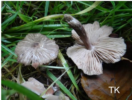
Abb. 12: Tigerrötling

Filzrötling genannt und erinnert an einen Ritterling. In Deutschland steht er auf der Liste der Verantwortungsarten (LÜDERITZ & GMINDER 2014). Der Tigerrötling wurde 1984 erstmalig in der Bundesrepublik nachgewiesen (SCHWÖBEL 1985).