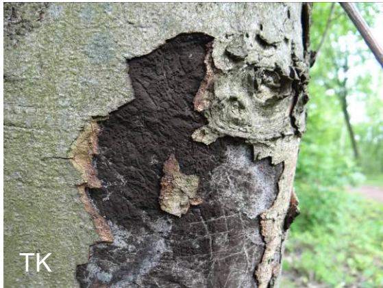
Abb. 6: Cryptostroma -Rindenkrankheit

Mönchengladbach, Kaarst und Krefeld war der Befall noch größer.