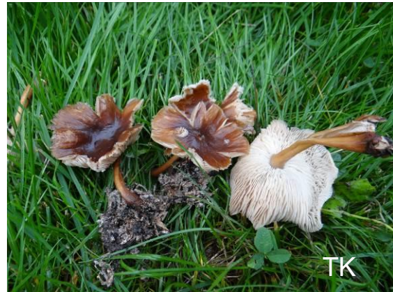
Abb. 10: Üppiger Büschel-Rübling

Skandinavien anhand untersuchter Herbarbelege nach.