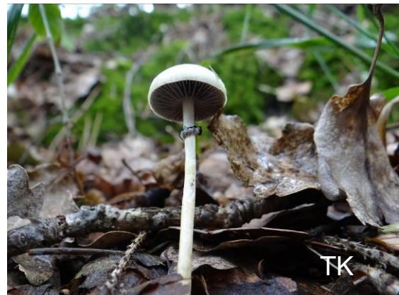
Abb. 11: Schiefporiger Träuschling

Die Art wird auch in HORAK 2005 geschlüsselt, aber wohl häufig nicht beachtet. Auch Protostropharia dorsipora war nach www.pilze-deutschland.de ein Neufund für NRW.