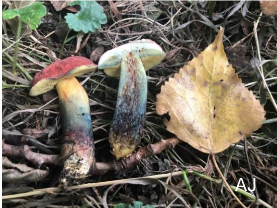
Abb. 9: Ufer-Filzröhrling

bung weist der Starkblauende Rotfußröhrling ( Xerocomellus cisalpinus ) auf, der aber eine andere Hutdeckschichtstruktur aufweist. Der Ufer-Filzröhrling wurde im August in Velbert in einem Auwald gefunden. Nach den Angaben in www.pilze-deutschland.de handelt es sich dabei um den Erstfund in NRW.