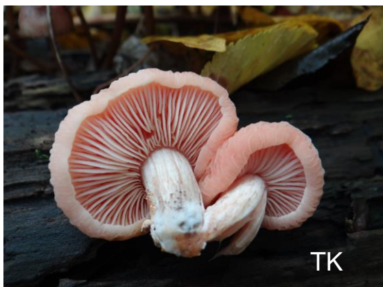
Abb. 22: Rosa Adernseitling

Das Pilzjahr 2019 war damit aber noch nicht vorbei. Anfang Dezember wuchs in Duisburg auf Pappelholz der Rosa Adernseitling ( Rhodotus palmatus ). Diese sehr seltene Art wurde in Deutschland zuerst im Kerpener Bruch an Ulme gefunden (KRIEGLSTEINER 1979). Der Hut ist bis 8 cm breit, rosa und zähfleischig, die Oberseite ist teilweise aderig-runzelig bis netzig gefeldert. Der Pilz bevorzugt wintermilde Auenwälder und ist in NRW nach pilzdeutschland.de fast nur aus dem Rheinland bekannt. Die einzige westfälische Fundstelle lag 2005 und 2006 an der Fuelbecke-Talsperre.