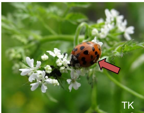
Abb. 4: Marienkäferpilz

Ende April wurde im Garten der Biologischen Station in Herne ein Marienkäfer fotografiert. Bei genauerer Ansicht der Fotos wurde auf dem Marienkäfer der Pilz Hesperomyces virescens entdeckt. Dieser „ Marienkäferpilz “ parasitiert vor allem den Asiatischen Marienkäfer ( Harmonia axyridis ).