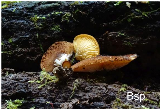
Abb. 21: Safranblättriges Stummelfüßchen

Die Art ist weltweit verbreitet, z. B. USA, Polen, Türkei, aber in ganz Europa selten. Die Art ist makroskopisch an den braunen Schuppen und den gelblichen Lamellen gut charakterisiert. Ein Schlüssel und Mikrozeichnungen finden sich in SENN-IRLET 1995. Als Größe der Fruchtkörper werden dort 35 (55) mm angegeben. Die Fruchtkörper erreichen in älteren Stadien problemlos die angegebenen Maximalwerte.