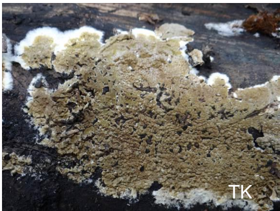
Abb. 1: Brauner Kellerschwamm

Im Januar wurden im Botanischen Garten der Ruhr-Universität Bochum und im angrenzenden Kalwes 109 Pilzarten festgestellt, darunter der Braune Kellerschwamm ( Coniophora puteana ). Er bildet dünne, flach am Substrat anliegende, braune Fruchtkörper mit weißem Zuwachsrand. Charakteristisch ist das Auftreten kleiner warzenartiger Erhebungen auf der Oberseite. Der Pilz wächst in feuchten Wäldern, aber auch auf verbautem Holz in Häusern. Zum Wachstum benötigt er eine hohe Feuchtigkeit im Holz. Er verursacht eine Braunfäule (Würfelbruch) und wurde auch auf Reetdächern festgestellt.