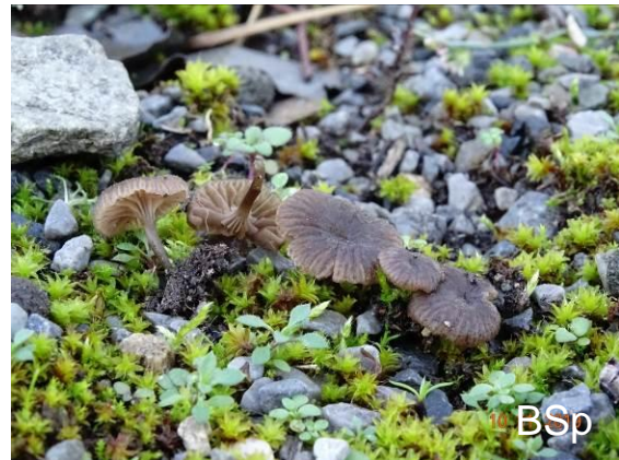
Abb. 19: Graphitstieliger Rötling

3 Fundpunkte in NRW, darunter einer von der APR-Exkursion vom Januar 2012 im Botanischen Garten der Ruhr-Universität Bochum. Anzumerken ist, dass Ludwig E. flocculosum und E. phaeocyathus als identisch auffasst. E. rusticoides wächst auf humusarmen Sandböden und ähnelt E. graphitipes , wird aber etwas größer. Der Fund in Duisburg war der Erstnachweis für E. graphitipes in NRW.