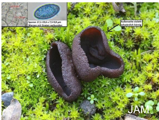
Abb. 18: Violett-punktierter Becherling

Auch auf der Exkursion im Duisburger Landschaftspark-Nord wurde der Graphitstielige Rötling ( Entoloma graphitipes f. cystidiata ) gefunden. Dieser kleine Rötling hat Nabelingshabitus und erst der Blick ins Mikroskop ergab die Gattungszugehörigkeit. Er gehört in die Gruppe um den Braunblättrigen Glöckling ( Entoloma rusticoides ). Zu der Gruppe gehören u. a. E. phaeocyathus und E. flocculosum . E. graphitipes wurde zuerst 1982 in Berlin auf einem Kinderspielplatz gefunden und später von Erhard Ludwig als neue Art beschrieben (LUDWIG 2007). Später wurde die Art auch in Spanien und in Norwegen gefunden (WEHOLT et al. 2016). Ein Schlüssel für die Gruppe findet sich bei VILA 2014. E. flocculosum ist für NRW bei www.pilze-deutschland.de nicht angegeben. (Anm.: das Artporträt im Tintling von KASPAREK 2000 beruht auf einem Fund aus dem Saarland). E. phaeocyathus besitzt