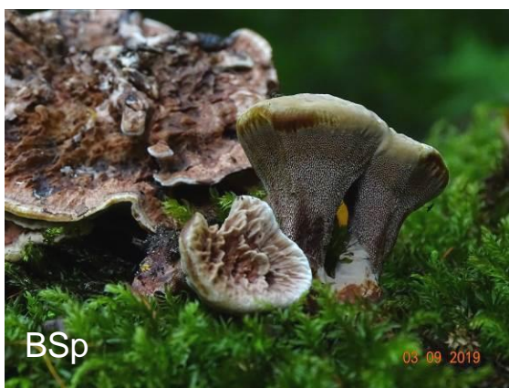
Abb. 13: Grubiger Korkstacheling

Anfang September wuchs im Rotbachtal an der Grenze Oberhausen / Bottrop ein bemerkenswerter Pilz. Es war der Grubige Korkstacheling ( Hydnellum scrobiculatum ). Stachelinge sind Mykorrhiza-Pilze und benötigen nährstoffarme Böden (z. B. auch die Duftstachelinge Phellodon ). H. scrobiculatum wächst sowohl im Nadel- als im Laubwald. Makroskopisch sehr ähnlich ist der Gezonte Korkstacheling H. con-crescens . Diese Art besitzt jedoch Sporen mit leicht eckigen bis abgestutzten Warzen, während sie bei H. scrobiculatum abgerundet sind. Der Fund vom Rotbach war der Zweitfund für NRW.