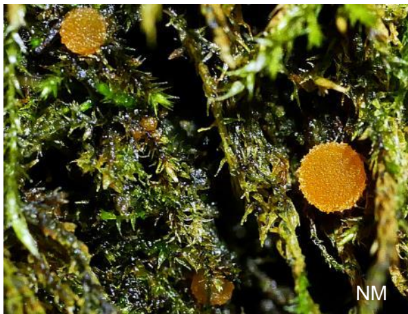
Abb. 3: Octospora wrightii