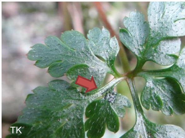
Abb. 1: Coleroa robertiani - Ruprechtskraut-Kugelpilz

Bemerkenswert: Beide Sarcoscypha -Arten am gleichen Standort wachsend.