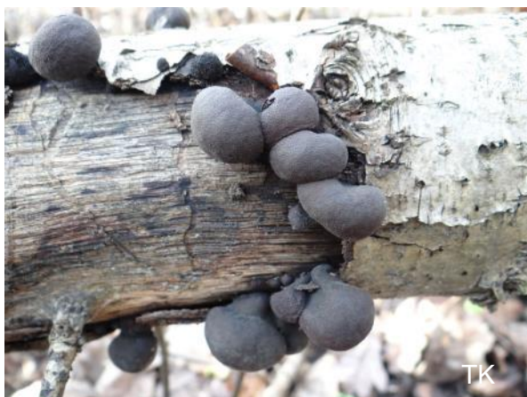
Abb. 5: Daldinia childiae - Birnenförm. Holzkohlenpilz