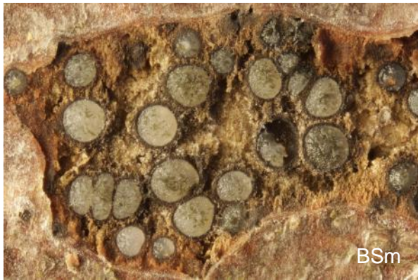
Abb. 7: Pleomassaria carpini