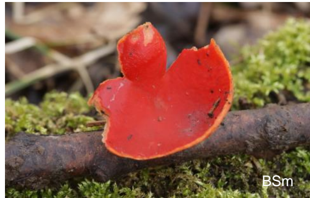
Abb. 8: Sarcoscypha coccinea – Zinnoberroter Prachtbecherling