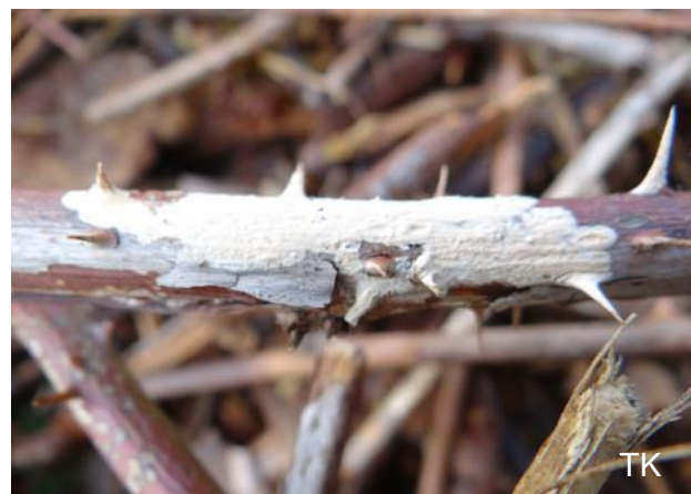
Abb. 6: Aleurodiscus aurantius - Goldorange Mehlscheibe