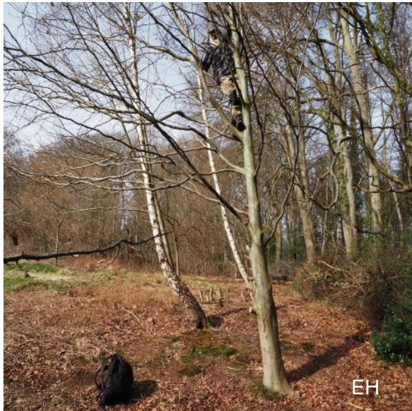
Abb. 9: Einer behält den Überblick