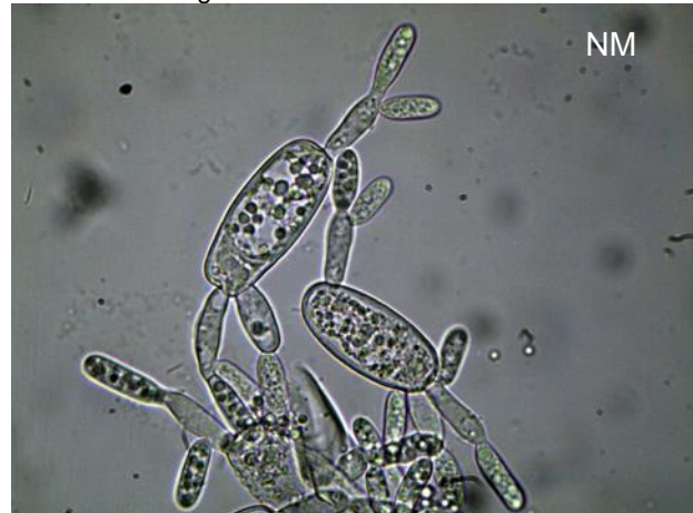
Abb. 10: S. austriaca : Sporenkeimung