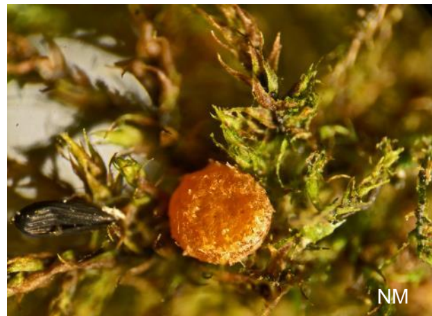
Abb. 4: Octospora wrightii