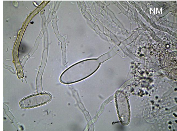
Abb. 11: S. coccinea : Sporenkeimung