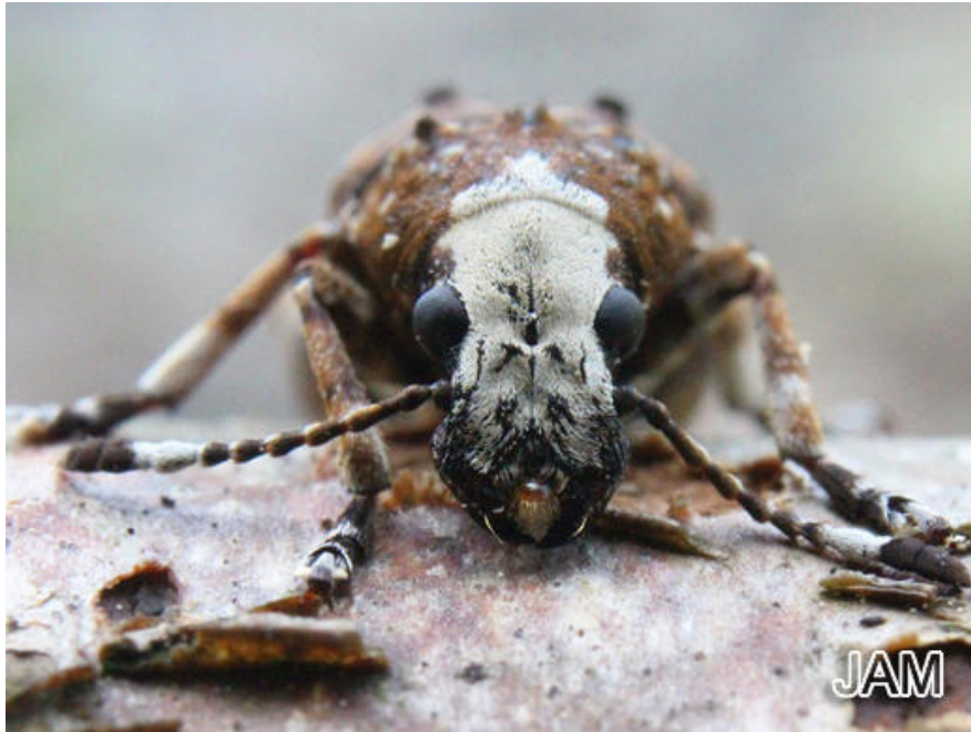
Abb. 1: Großer Breitrüssler

Bemerkenswert war z.B. Simocybe coniothora - Kopfstyden- Olivschnitzling.