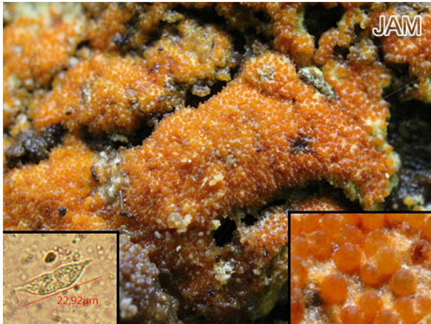
Abb. 3: Hypomyces aurantius Goldgelber Schmarotzer-Pustelpilz