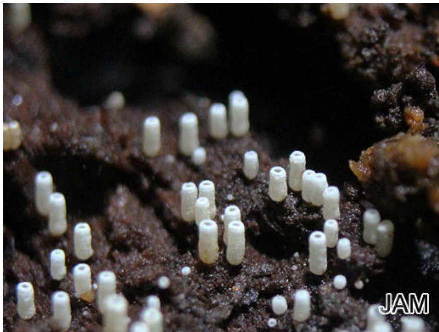
Abb. 2: Henningsomyces candidus - Reinweisses Hängeröhrchen