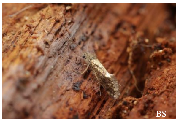
Abb. 1: Eichen-Purpurmotte