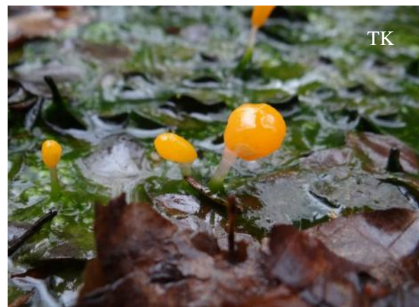
Abb. 2: Sumpfhäubchenpilz ( Mitrula paludosa )