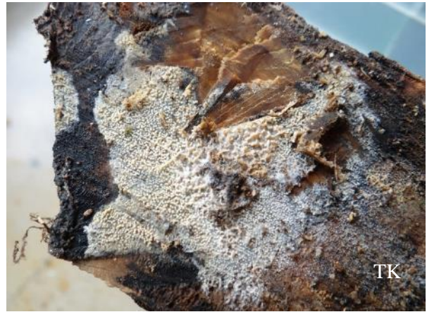
Abb. 4: Warziger Zähnchen-Rindenpilz ( Xylodon nespori )