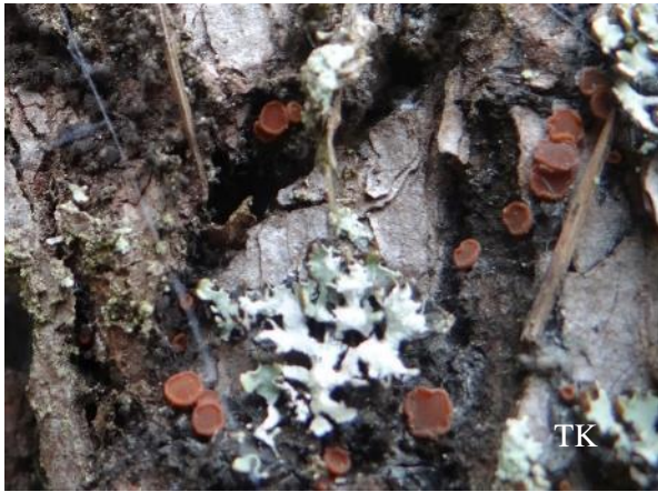
Abb. 3: Gelbes Harzbecherchen ( Sarea resiniae )