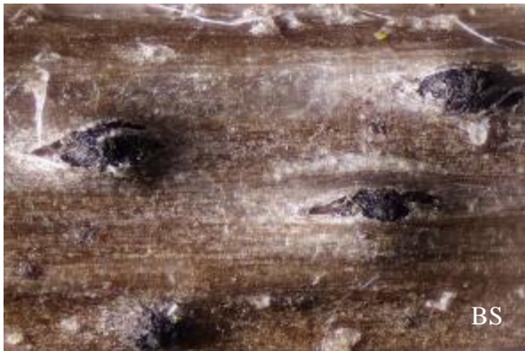
Abb. 5: Zugespitzter Schlangenwerferkugelpilz ( Ophiobolus acuminatus )