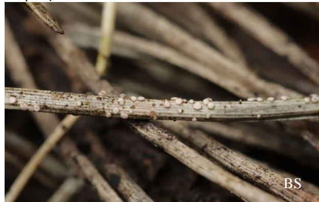
Abb. 6: Weißbraunes Kiefernadelbecherchen ( Pseudohelotium pinetii )