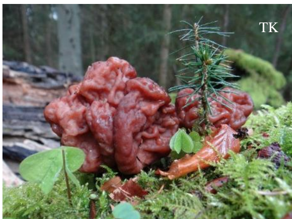
Abb. 1: Frühjahrslorchel ( Gyromitra esculenta )