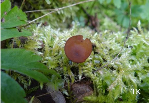
Abb. 1: Anemonenbecherling