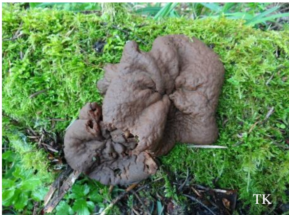
Abb. 3: Scheibenlorchel ( Gyromitra ancilis )