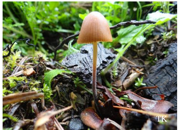
Abb. 4: Langstieliges Samthäubchen ( Conocybe subpubescens )