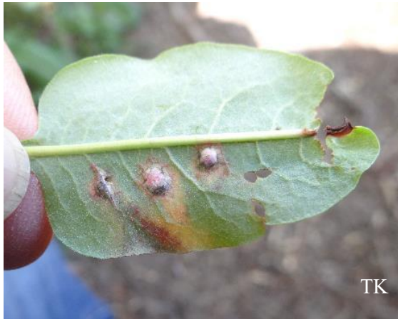
Abb. 1: Microbotryum pustulatum – Wiesenknöterich-Pustelbrand