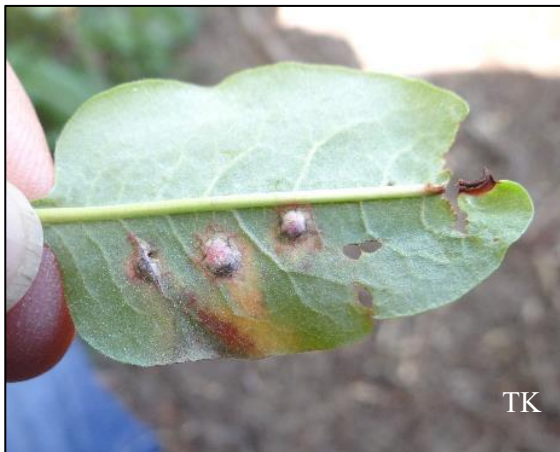
Abb. 1: Microbotryum pustulatum – Wiesenknöterich-Pustelbrand

Bemerkenswert war v. a. Lophiotrema borealiforme .